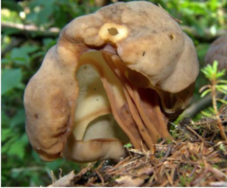
Klotsporig murkla

Vandringen efter den gamla torparvägen mellan Tunbodarna och Västanå erbjuder dig mycket att se. Här passerar du vacker natur, Mjällådalens intressanta geologi och historiska minnesmärken. Du vandrar genom ett dramatiskt landskap och stigen mynnar sedan ut vid det vackra Västanåfallet. Leden är en del av Rotenleden som går mellan Västanå och Rotsjö gård. Efter stigen finns geocacher.