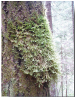
Aspfjädermossa som kan hittas efter stigen.

En stig med historiska anor som också passerar genom Mjällådalens intressanta och dramatiska natur. Stigen går från Tuna by till fäbodarna öster om Mjällån, men delar är idag på vissa sträckor ersatt av skogsbilväg. Du kan välja flera olika turer efter leden beroende på om du vill gå långt eller kort. En mycket populär sträcka är att gå mellan broarna, dvs från Petter Norbergsbron till Jällviksbron. Efter stigen finns en kalkkälla, fångstgropar och en geocache.