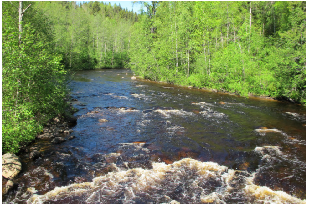
Utsikt över Mjällån från Petter Norbergsbron

Du går på historiska stigar som har använts och brukats genom decennier. Området kring Mjällån är mycket sevärt för den naturintresserade och arbete pågår för att skydda området. Se de