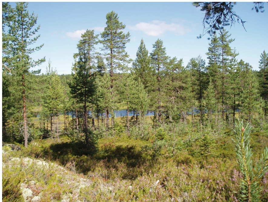
Utsikt från fikaplatsen vid den rofyllda tjärnen Flärken

Västra Frötuna fäbodlar. Vi vet att det här var byallmänning på 1700-talet. Det var därför naturligt att alla bönder i Frötuna samlade sina fäbodlar här. Här